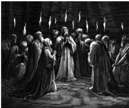
-a Szentlélek kitöltetése a tanítványokra-

Szoktunk énekelni, de elég ritkán tudunk önmagunktól, spontán dicséretet énekelni az Úristennek. Nagyon sokszor énekelünk és elsírjuk a múltunkat, nótákkal emlékezünk régi időkre, és elfelejtjük azt, hogy mi a jelenben élünk, és ebben a pillanatban a jelenünkért vagyunk felelősek, abban hogy miként szólunk, cselekszünk, hogyan énekelünk az Úristen dicsőségének, és főleg elfelejtjük azt, hogy előttünk áll a jövő, és úgy kell arra készülnünk, hogy olyan dolgokkal foglalkozunk, amelyek az örökkévalóságban megmaradnak.